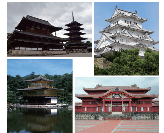
(左上から時計回りに)法隆寺、姫路城、首里城、金閣寺

【正解と解説】 問1①=職業や家族構成などを調べます。集計結果は後日公表され、政策決定などにさまざまな場面で利用されます。②=世論調査のことです。③=憲法改正に必要なのは「国民投票」です。問2④=平均寿命は、その年に生まれた0歳児が平均何年生きるかを推計した数値です。2018年は男性81.25歳、女性87.32歳で、男性は世界3位、女性は世界2位です。問3=例えば、作者の収入が減る△文化の衰退につながる。自国の一部は「正」の立場です。②「正」は「総務省」です。問4②=関税を上げると貿易が滞り、国々の対立や世界的不況を招きかねません。このため第二次世界大戦後の世界は、保護貿易とは逆の自由貿易を広がってきました。問5①=法隆寺の金堂で1949年、火災が発生し、壁画が燃えまじた。火災が起きた1月26日は「文化財防火デー」に定められ、全国の寺社で防火訓練が実施されています。問6③=日清戦争に勝った日本は、1895年から第二次世界大戦に敗れた1945年まで、台湾を統治していました。①中国は「台湾」